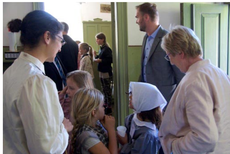
Fra kulturministerens besøg på Flakkebjerg Skolemuseum.

Jeg har selv trådt mine barnesko i det midtjyske i en folkeskole langt fra alting, og udflugter var, hvis vi var heldige, hensat til en enkelt gang på et skoleår. Det var jo ikke, fordi vi ikke kom rundt i området, det skete bare sjældent i vores undervisning. Jeg kan huske samtlige udflugter, vi havde ud af klasselokalet, og hvordan det tilførte vores undervisning en anden dimension – understøttede vores læring og gav os oplevelser socialt og fagligt, der var vigtige byggesten i vores almene dannelse som mennesker. Og netop derfor er det vigtigt, at museerne er tilgængelige i forhold til uddannelsesinstitutionerne. På Museum Vestsjælland har vi på de enkelte lokalafdelinger udviklet, afholdt og indgået i projektforsløb med de lokale uddannelsesinstitutioner igennem mange år. Med Kulturbussen blev disse bestræbelser yderligere konsolideret og den 28. august blev projektet en realitet med ministerbesøget.