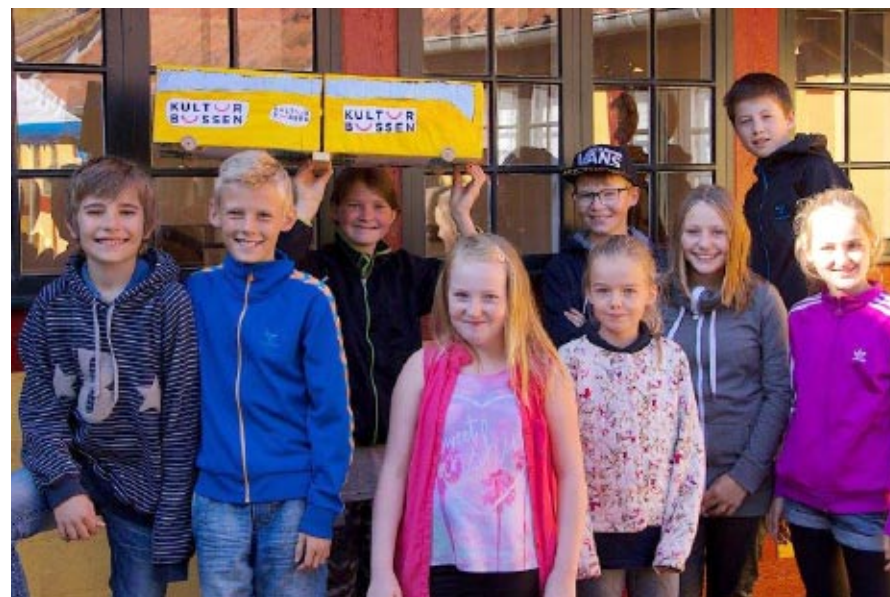
Skoleelever fra Pedersborg med deres lille model af kulturbussen.

Den 28. august 2014 indviede Kulturminister Marianne Jelved Kulturbussen, der er et samarbejdsprojekt mellem Museum Vestsjælland, Sorø Kunstmuseum og Museet for Samtidskunst. Med støtte fra Nordea-fonden er det gratis for grundskolerne over den næste treårige periode at benytte Kulturbussen i forbindelse med besøg på en af de tre institutioner. De smukke omgivelser på Sorø Museum dannede rammen om indvielsen, inden bussen efterfølgende kørte videre til Flakkebjerg, hvor Kulturministeren så et uddrag af et af museets undervisningstilbud.